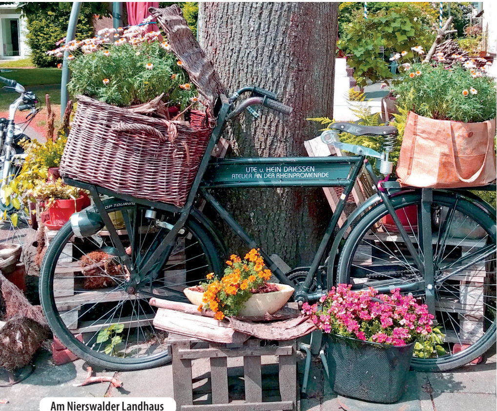
Am Nierswalder Landhaus

Wir befahren nun für 1,7 Kilometer den Niers-Radwanderweg unmittelbar neben dem Fluss, strecken-