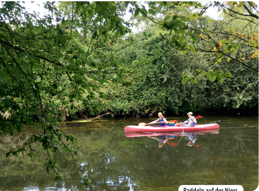
Paddeln auf der Niers

Um die denkmalgeschützte Kirche herum wachsen Weinstöcke in langen Reihen, rundum mit grünen