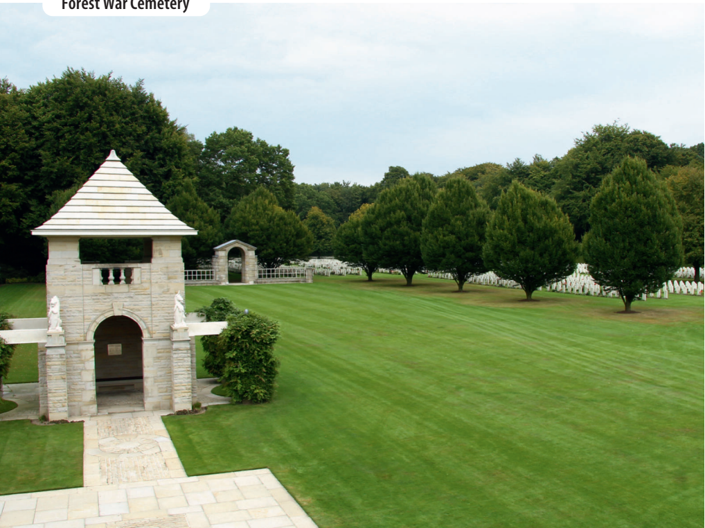
Forest War Cemetery

Von hier folgen wir dem Radweg neben der L 484, wenden uns nach 500 Metern links zurück in den Reichswald und nach weiteren 700 Metern an der ersten Wegkreuzung wieder rechts. Nun fahren wir immer geradeaus, wie an der Schnur gezogen, weiter auf dem festen Waldweg. Wir bleiben stets im flachen Südteil des Reichswaldes, weiter im Norden liegen einige der höchsten Erhebungen des Niederrheins.