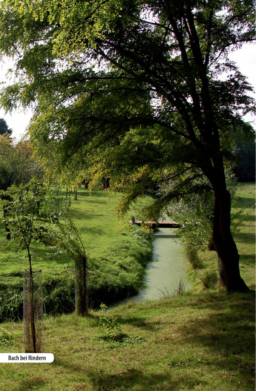
Bach bei Rindern