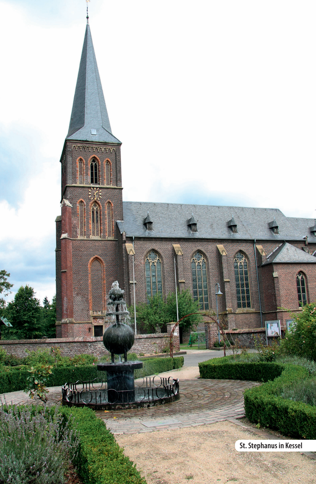
St. Stephanus in Kessel