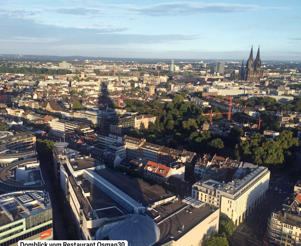
Domblick vom Restaurant Osman30

bergs. Er ist einer der elf Trümmerberge in Köln. Hier wurde also nach dem Zweiten Weltkrieg der Schutt aus der Innenstadt aufgeschüttet und bepflanzt. Im Volksmund heißt der Berg Mont Klamott .