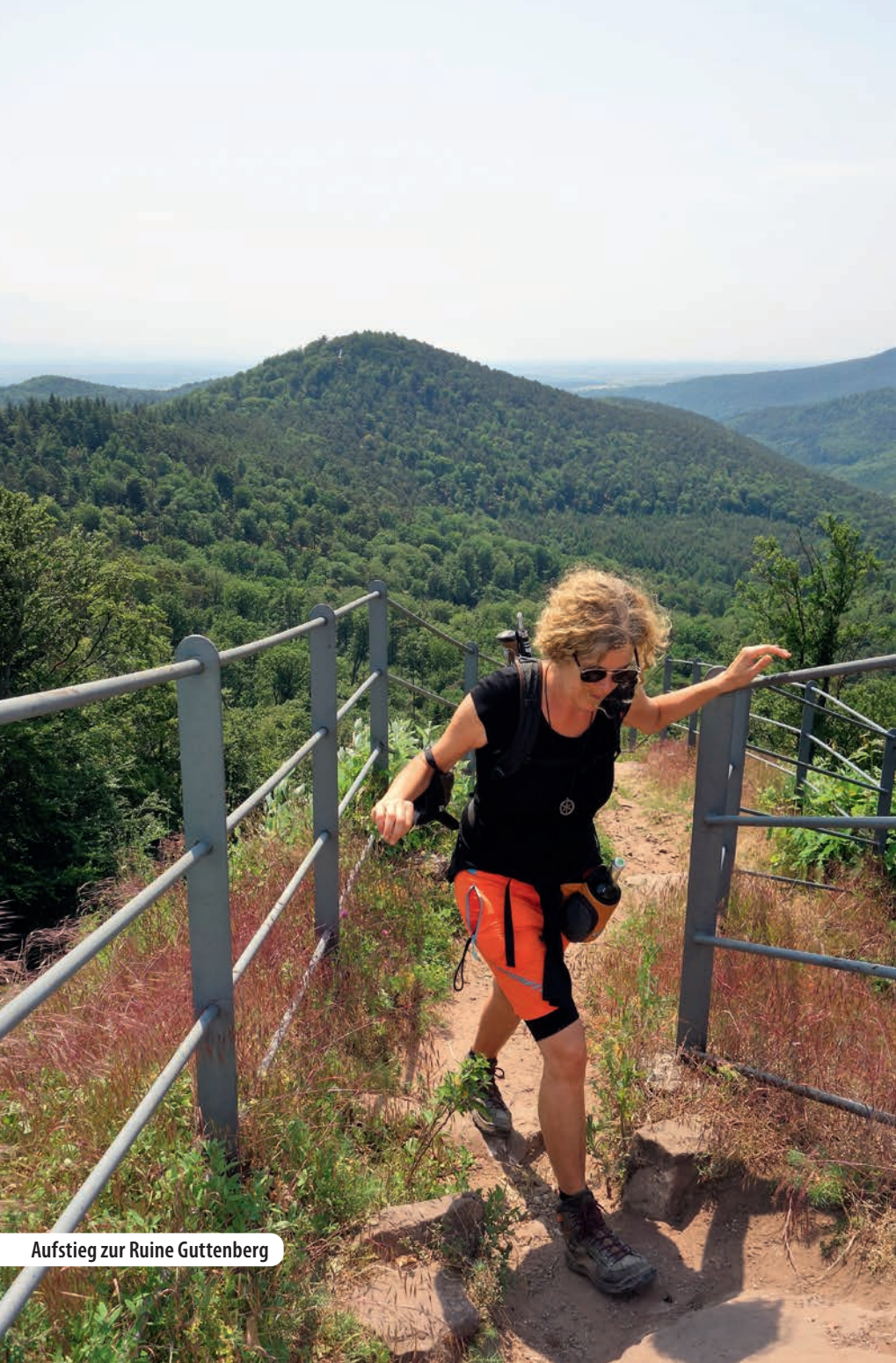
Aufstieg zur Ruine Guttenberg