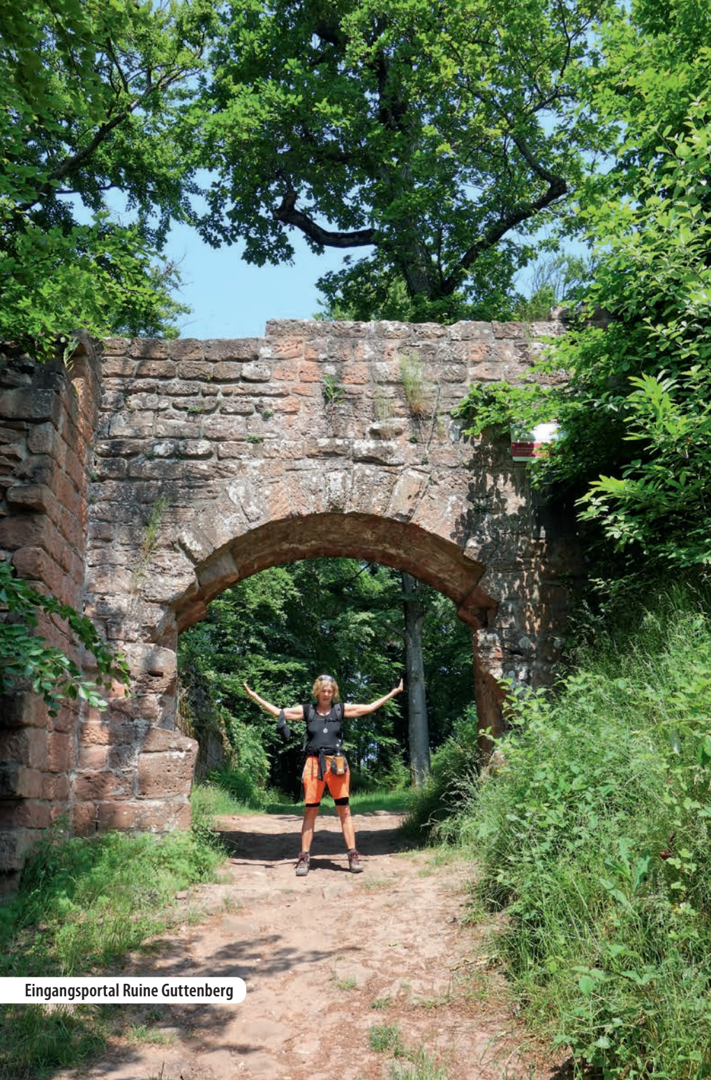
Eingangsportal Ruine Guttenberg