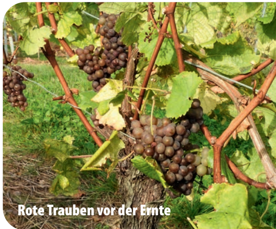
Rote Trauben vor der Ernte

Kirschroth ist eine kleine Weinbaugemeinde mit knapp 300 Einwohnern bei Bad Sobernheim in einem südlichen Seitental der Nahe. Im Ort gibt es acht Weingüter.