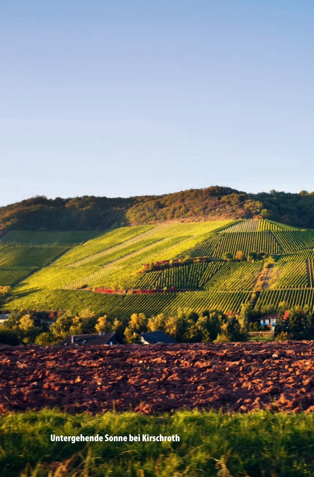
Untergehende Sonne bei Kirschroth